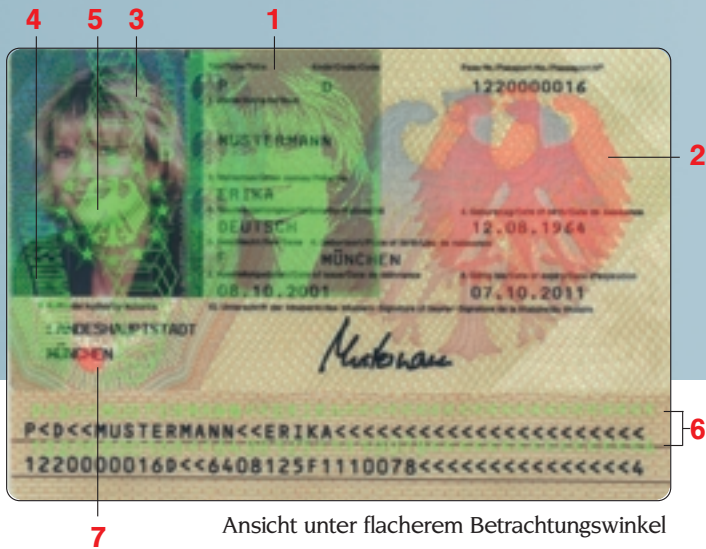
Ansicht unter flacherem Betrachtungswinkel