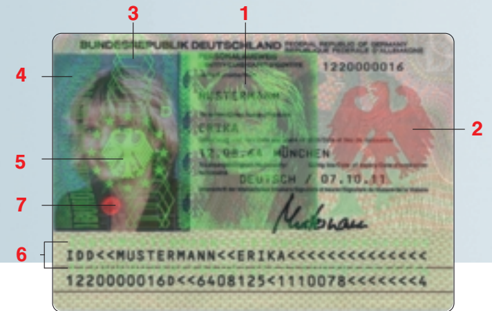
Ansicht unter flacherem Betrachtungswinkel